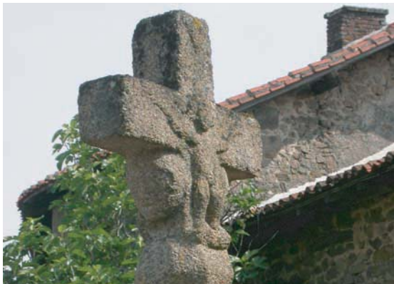
Photo : la croix de Roussis